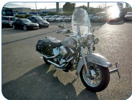
HARLEY DAVIDSON Softail Heritage, 18 950 km, de 2004