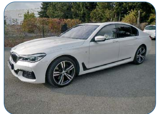
BMW 750i Xdrive 450 Ch M Sport, ba, de 2016

Mais aussi : AUDI A6 Avant, 2013 - AUDI A4 Quattro, 2015 - BMW X1 Sdrive, 2016 - CITROËN C4 Picasso, 2010 - DS3, 2015 FORD S-Max, 2013 - FORD C-Max, 2014 - FORD Edge, 2016 - NISSAN Micra, 2015 PEUGEOT 3008, 2010 - PEUGEOT 5008, 2015 - VOLKSWAGEN Golf, 2015