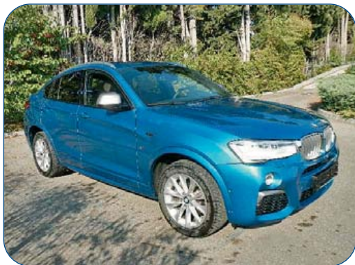
BMW X4 M40i 360 Ch, 11 360 km, de 2016