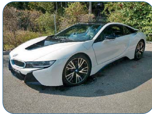
BMW i8 1.5 Edrive Hybrid, 19 820 km, de 2015