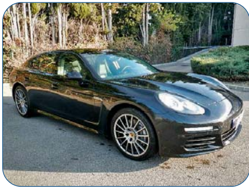
PORSCHE Panamera, diesel, de 2015