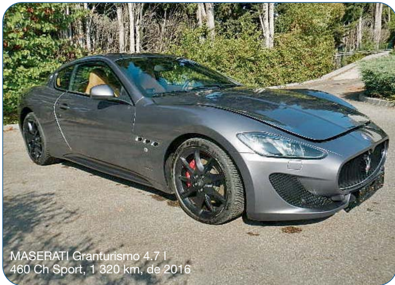
MASERATI Granturismo 4.7 I 460 Ch Sport, 1 320 km, de 2016