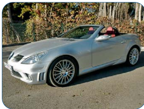
MERCEDES SLK55 AMG, ba, 36 100 km, de 2005