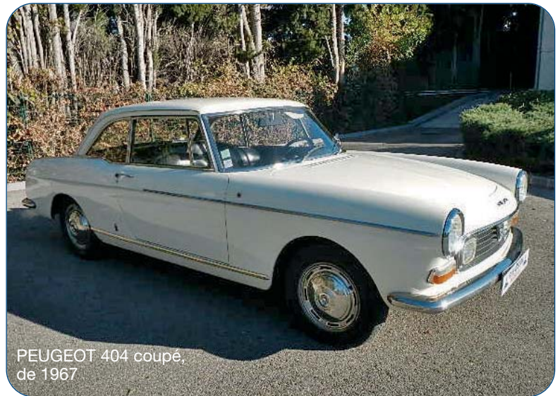
PEUGEOT 404 coupé, de 1967