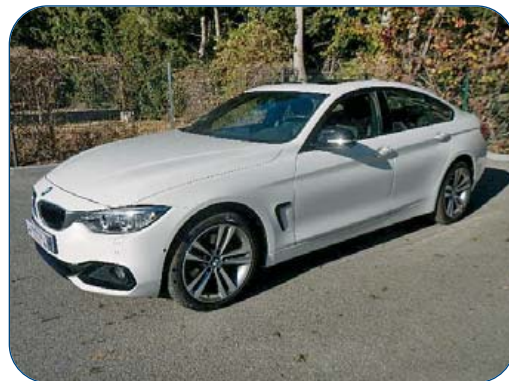
BMW Serie 4 Grand Coupé 420 DA Xdrive 184 Sport, 22 560 km, de 2014