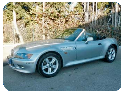
BMW Z3 cabriolet 1.8 Roadster, de 2000

© AUCTIONS PRESS Moto HARLEY DAVIDSON Softail Heritage BMW Z3 cabriolet 1.8 Roadster © MERCEDES SLK55 AMG, ba